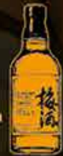
フレーバーハイボール