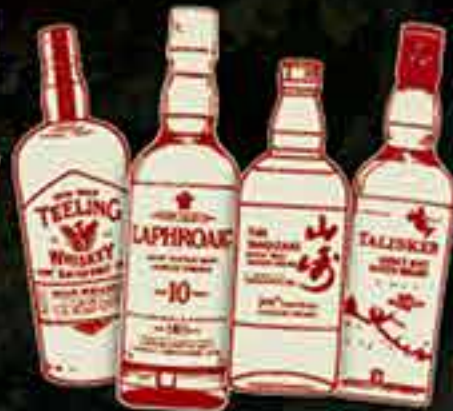
白州・山崎含む、プレミアムウイスキー