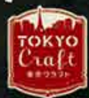
プレミアムビール